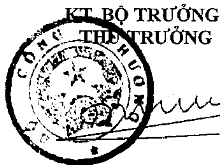
Đỗ Thắng Hải